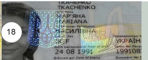
18. Імплантований захисний елемент

Імплантований захисний елемент складається із стилізованих зображень малого Державного Герба України та Державного Прапора України.