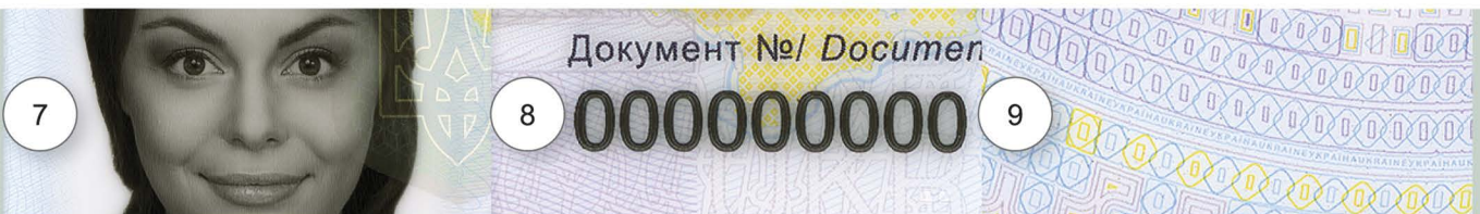
7. Фрагмент лазерного гравіювання (збільшений у 2 рази)