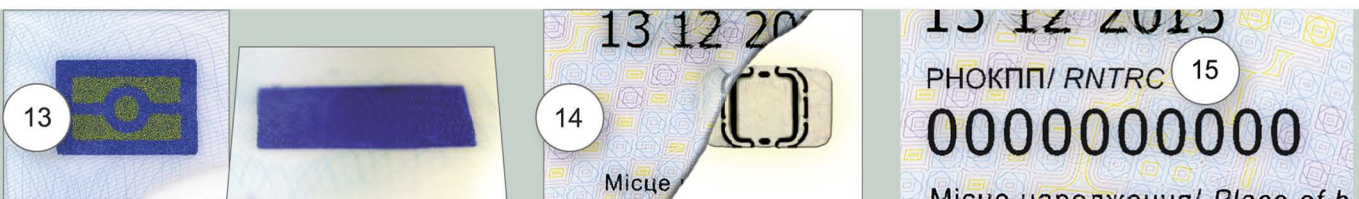
13. Спеціальний символ, який свідчить про наявність безконтактного електронного носія, виконаний оптико-перемінною фарбою, що під гострим кутом змінює колір із золотого на синій та стає невидимою на фоні прямокутника, виконаного фарбою синього кольору