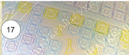
17. Фрагмент рельєфно-гравірувального елемента (збільшений у 5 разів)