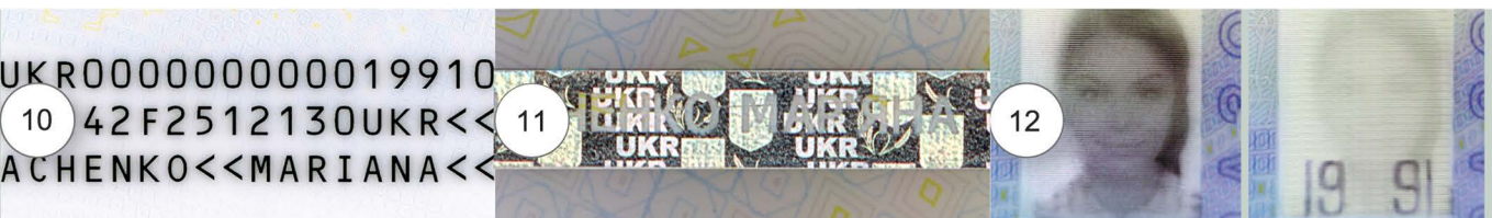
10. Машинозчитувана зона