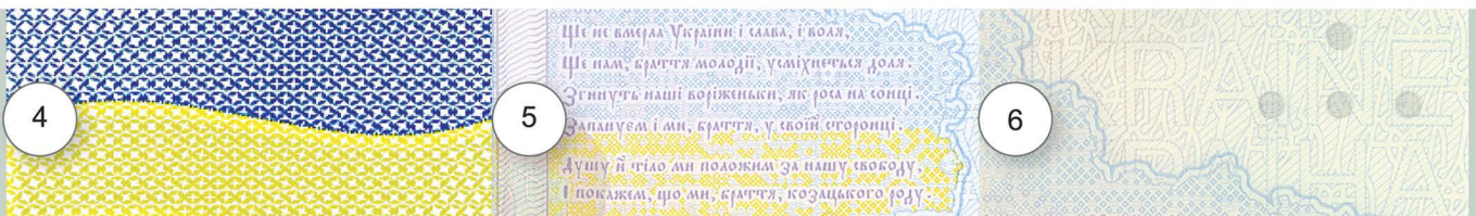
4. Фрагмент зображення Державного Прапора України (збільшений у 6 разів)