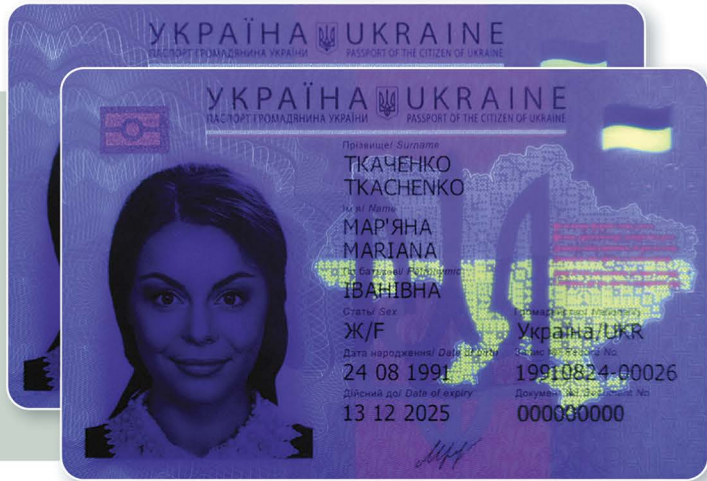
Лицьовий бік картки під дією джерела ультрафіолетового опромінювання