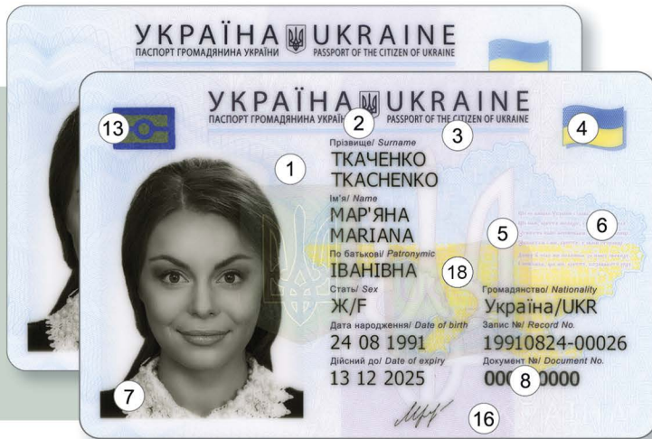
Лицьовий бік картки