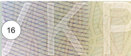
16. Фрагмент рельєфно-гравірувального елемента - слова "УКРАЇНА" (збільшений у 6 разів)