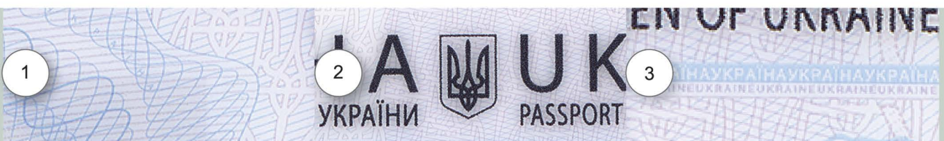
1. Фрагмент захисної сітки (збільшений у 4 рази)