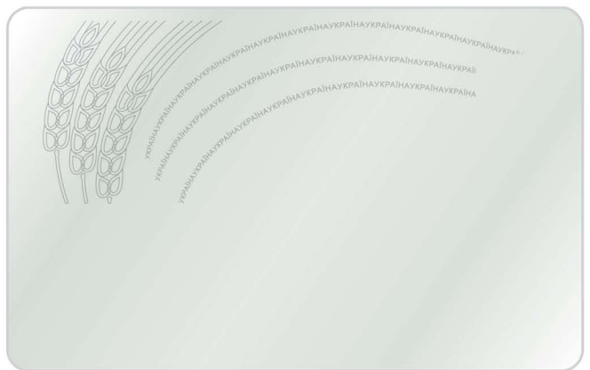
Захисні рельєфно-гравірувальні елементи, відчутні на дотик (зворотний бік)