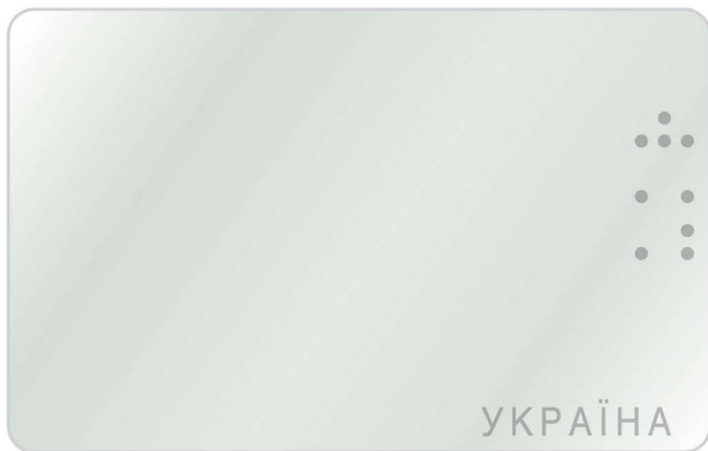
Захисний гравірувальний елемент, відчутний на дотик (лицьовий бік)