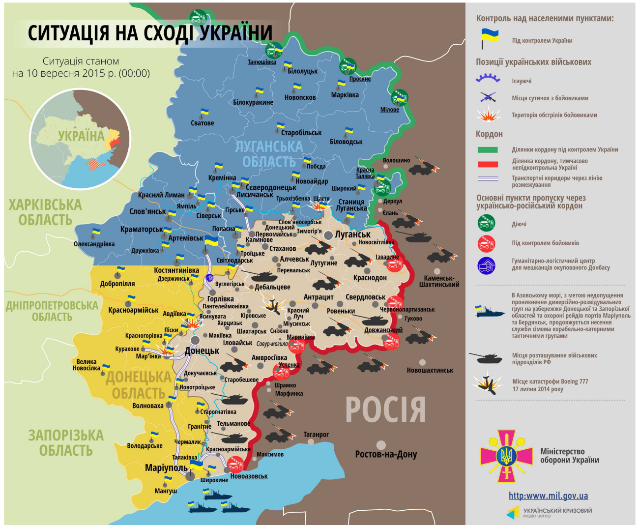
Мал. 3. Мапа АТО.

Так, донедавна, через пункт перетину українсько-російського кордону «Червонопартизанськ», до Росії щоденно пішки виходило близько трьох десятків чоловіків. А вже на цьому тижні злочинці заборонили перетинати кордон мешканцям Донбасу молодше 50 років.