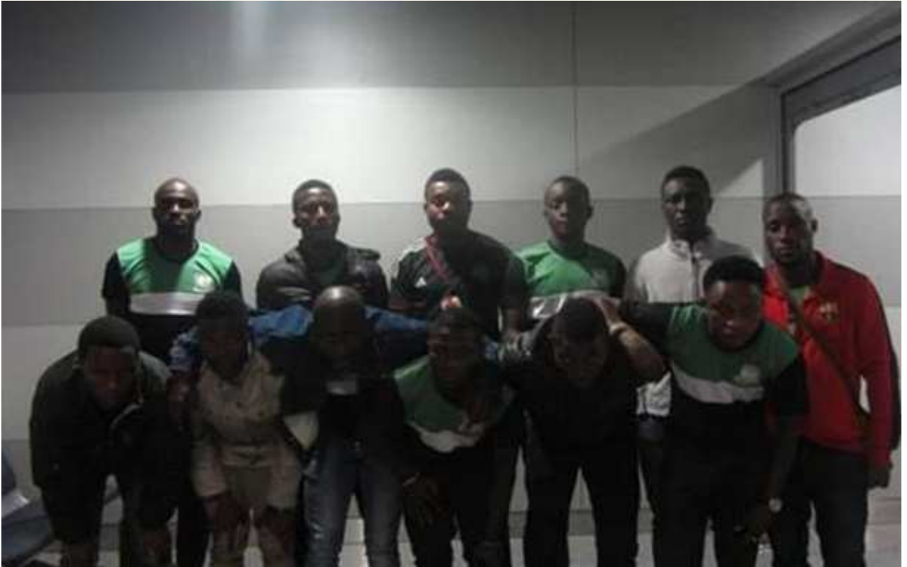
Фото 1. «Футбольна» команда з Нігерії.

Крім того, нещодавно ООН включив Україну до списку країн, на допомогу яким не вистачає грошей.