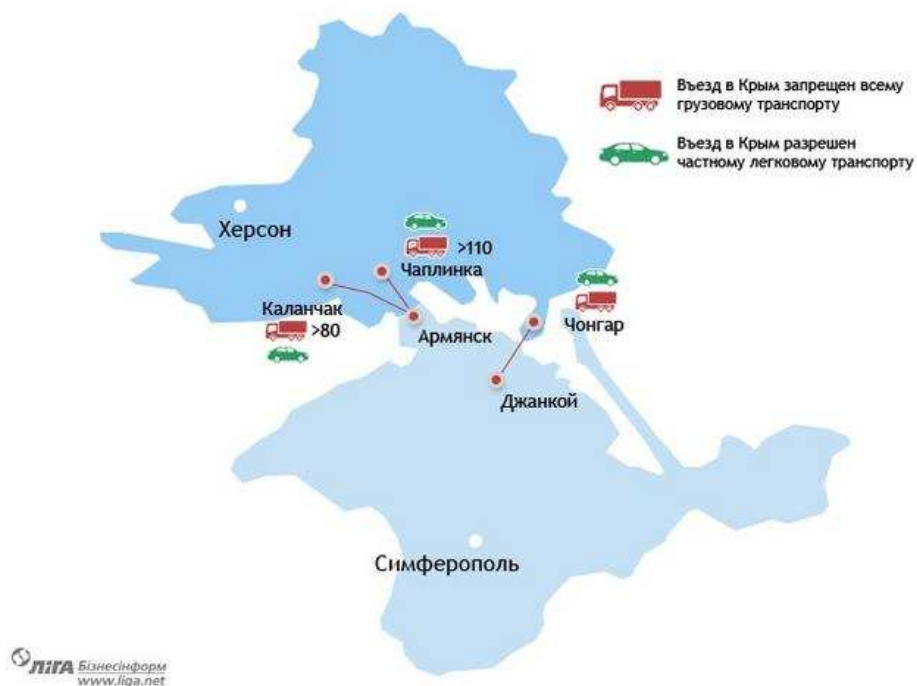
Мал. 3 – Контрольні пункти в'їзду-виїзду через адміністративний кордон між територією ВЕЗ "Крим" та іншою територією України

На адміністративному кордоні між територією ВЕЗ "Крим" та іншою територією України Меджліс кримськотатарського народу за підтримки українських націоналістичних організацій 20.09.2015 розпочав безстрокову акцію з блокування вантажного транспорту, що рухається з материкової України на півострів.