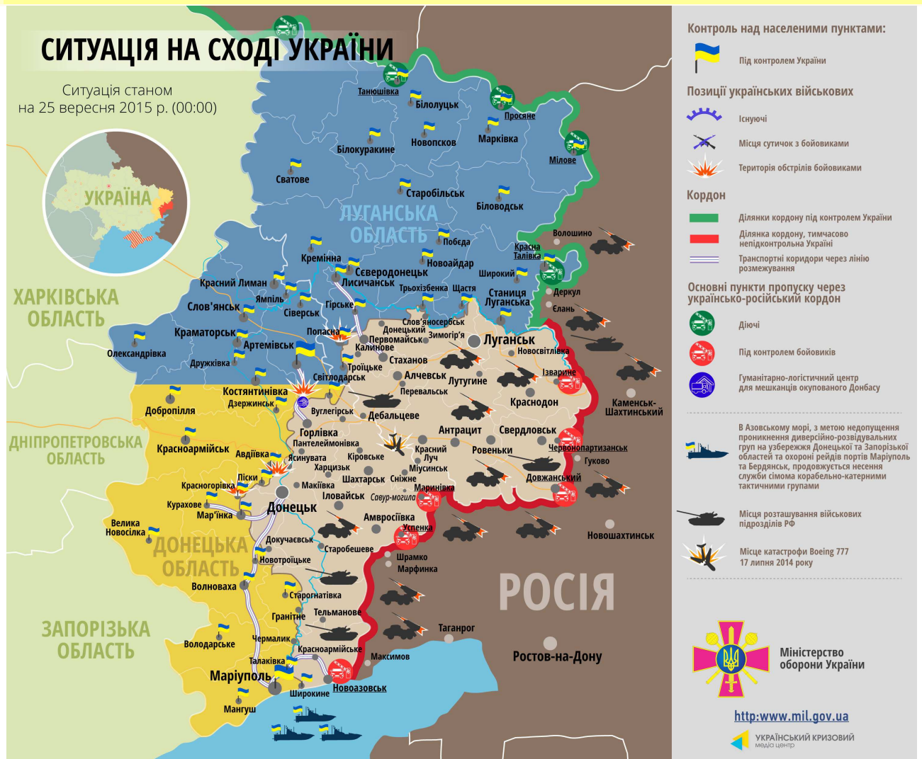
Мал. 1 – Мапа АТО станом на 24.09.2015.