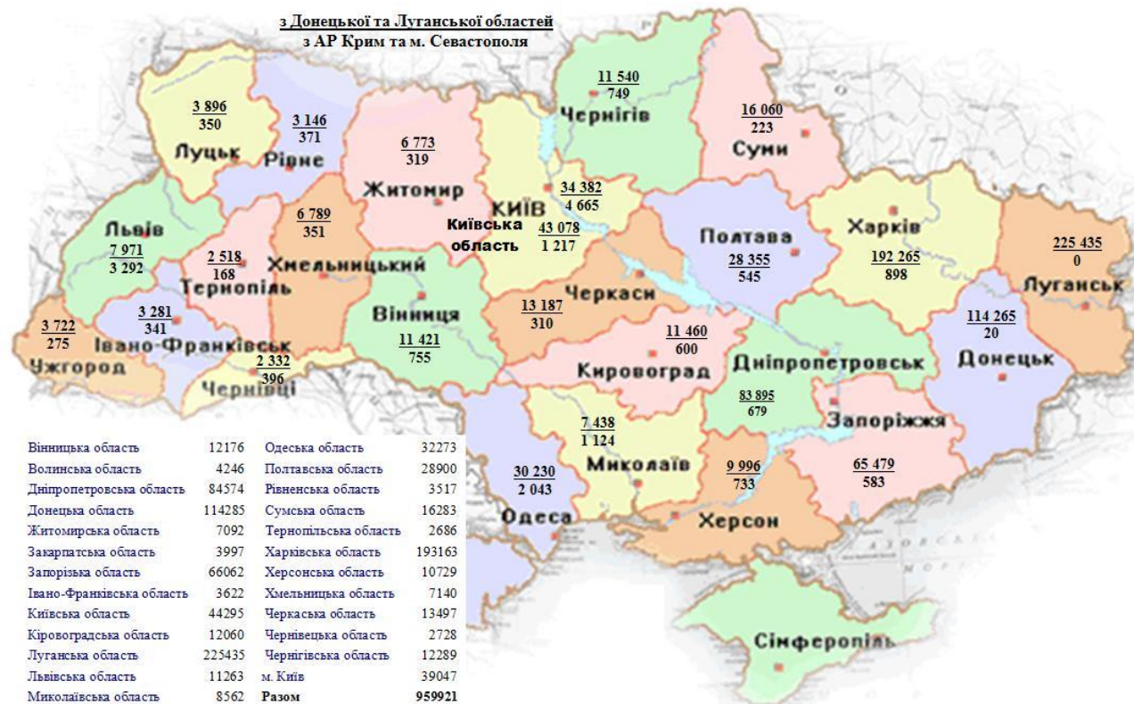
Мал. 3. – Розподіл внутрішньо переміщених осіб за регіонами переселення.