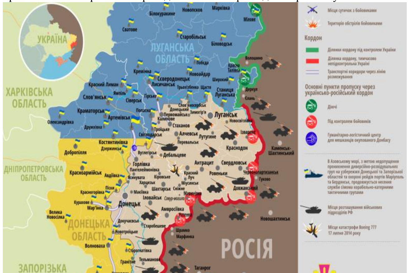
Мал. 2. Мапа АТО за 08.10.2015.

Наступним етапом виконання Мінських угод має стати відведення протитанкових гармат калібром до 100 міліметрів від лінії розмежування.