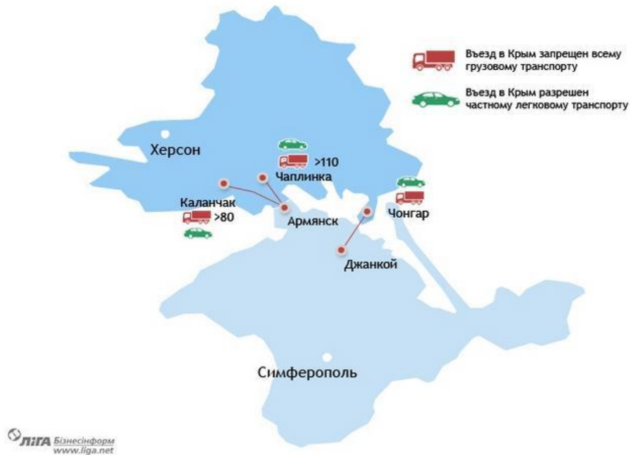
Мал. 4. Контрольні пункти в'їзду-виїзду через адміністративний кордон між територією ВЕЗ «Крим» та іншою територією України

транспорту, що рухається з материкової України на півострів через контрольні пункти в'їзду-виїзду через адміністративний кордон Чонгар, Чаплинка, Каланчак.