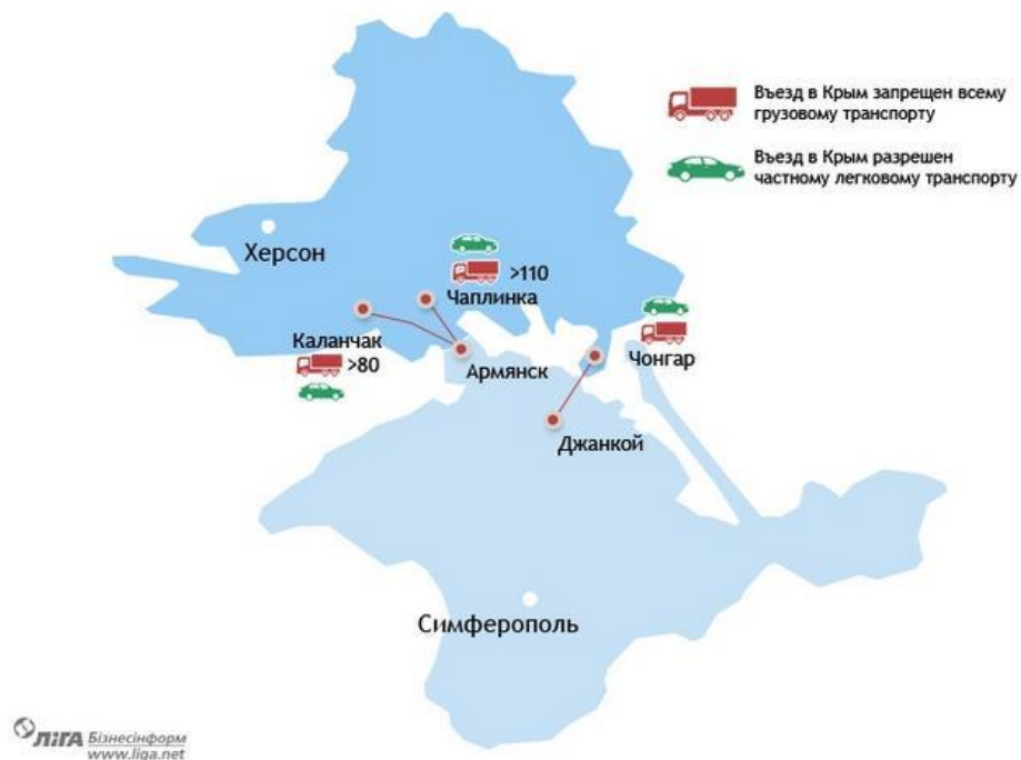
Мал. 4. – Контрольні пункти в'їзду-виїзду через адміністративний кордон між територією ВЕЗ "Крим" та іншою територією України

Водночас спостерігачі ОБСЄ звертають також увагу на тенденцію до повернення осіб з Російської Федерації до України.