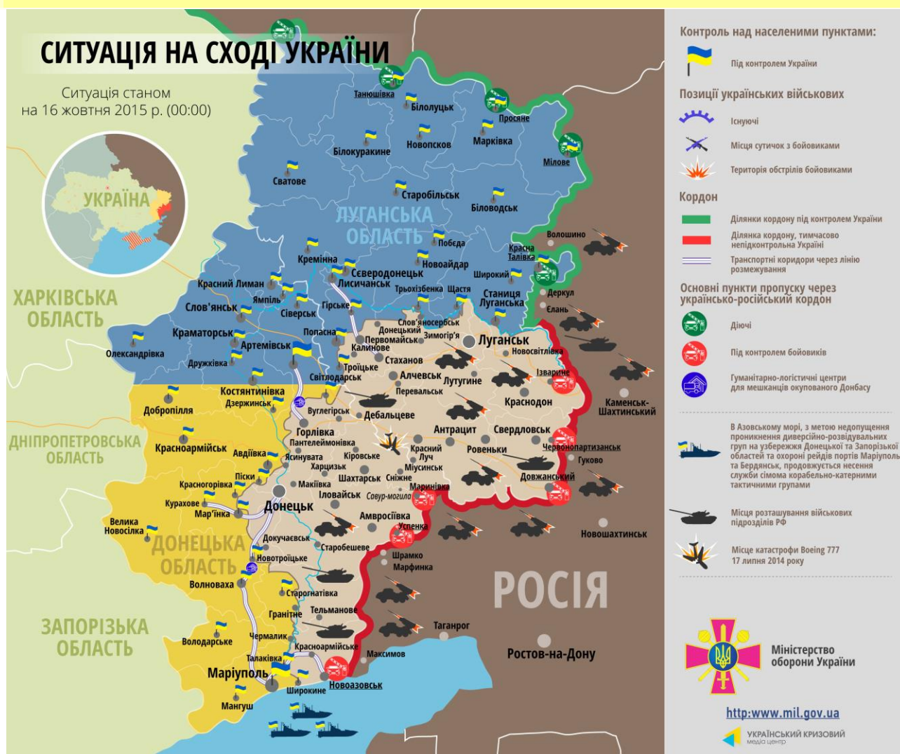
Мал. 1. – мапа АТО

15 жовтня у рамках доповнення до Мінських угод на Луганському напрямку розпочалася третя черга відведення озброєння, в ході якої українськими військовими з передової углуб тилу, на відстань більше 15 кілометрів, переміщено 12 мінометів калібру менше 100 мм. Відведення озброєння відбувається синхронно з відведенням мінометів таких же систем бойовиками так званої «ЛНР».