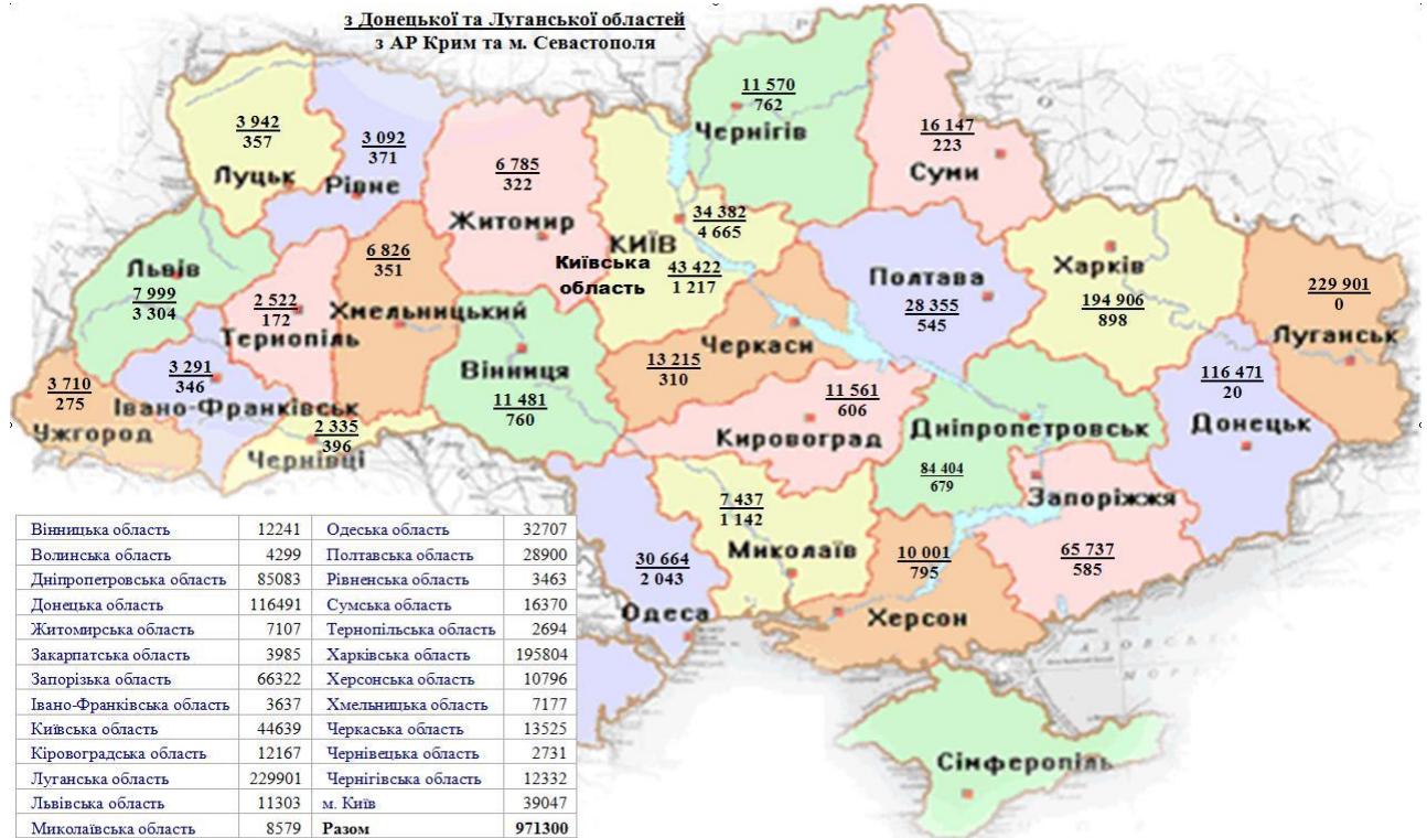
Мал. 2. – Розподіл внутрішньо переміщених осіб за регіонами переселення.

Як видно з малюнку 2 найбільші потоки внутрішнього переміщення осіб з районів проведення АТО спрямовані у східні та центральні регіони України (Луганська, Харківська, Донецька, Дніпропетровська, Запорізька, Київська області та місто Київ).